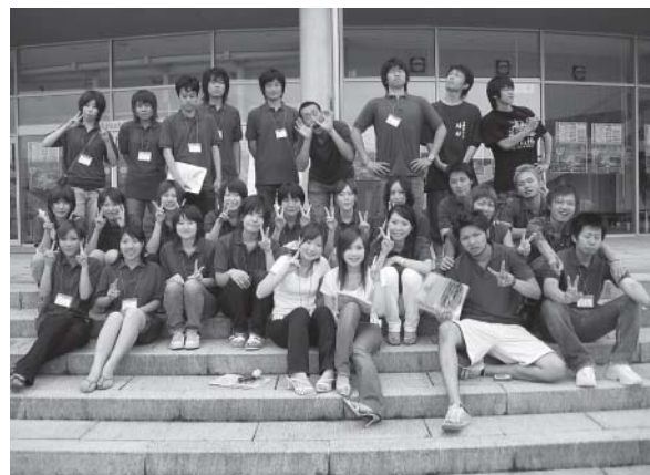
第1回オープンキャンパスで活躍した学生ボランティアのみなさん