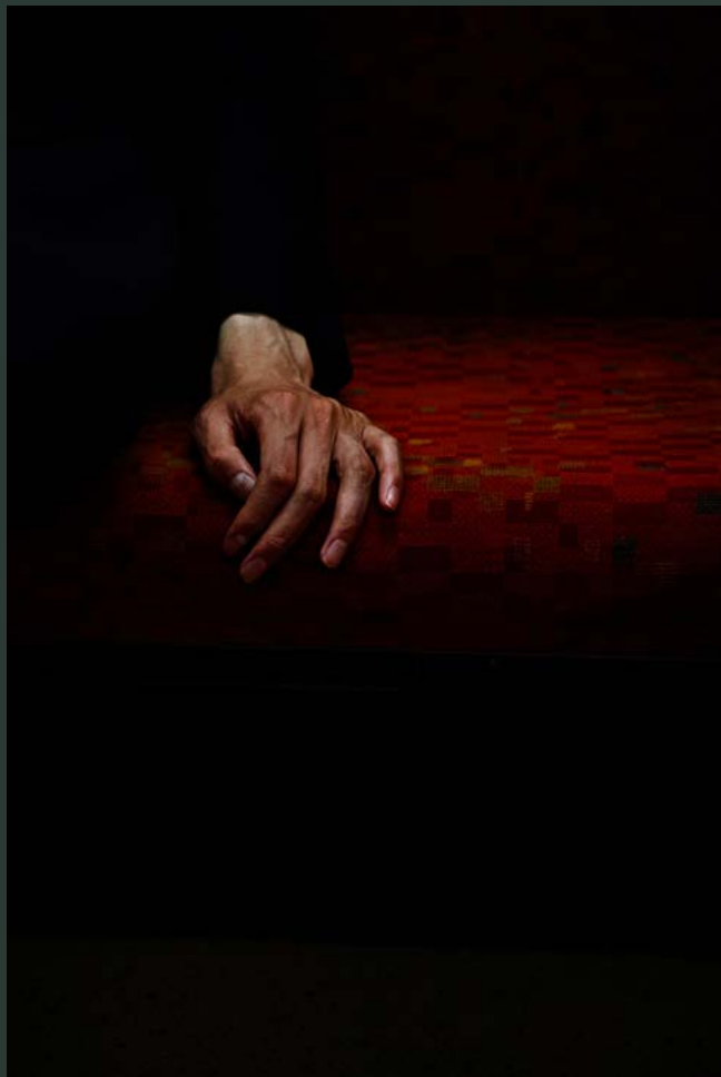
1. スディ | ソウル |アーカイブピグメントプリント 2. アリス・マハー | ろくろくubi | エッチング 3. 湯浅克俊 | 16 Zakura | 木版画