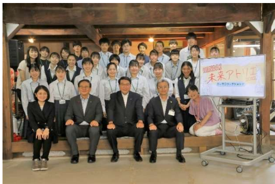
▲集合写真（写真撮影時のみマスクを外しています）

同日は新たに設置したサテライトキャンパス「YASUGI 未来アトリエ」にて、交流ワークショップ（以下WS）を行い、その後7月30日、8月17日の計3回開催しました。