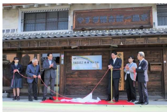
▲サテライトキャンパス除幕式の様子