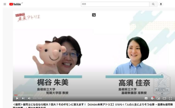
▲本学教員による事前動画の様子