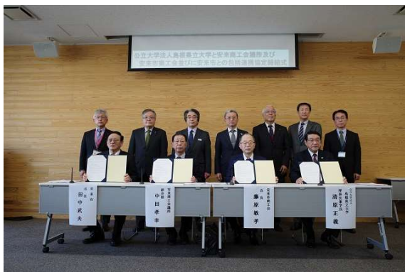
▲締結式の様子（写真撮影時のみマスクを外しています）

令和4年3月11日に、安来商工会議所及び安来市商工会並びに安来市との包括的な連携協定を結びました。これは高大連携、人材育成や産学の連携に寄与することを目的に締結され、今後、四者の密接な相互連携と協力を通して、地域の課題解決や発展に関する取り組みを行うことを目指します。