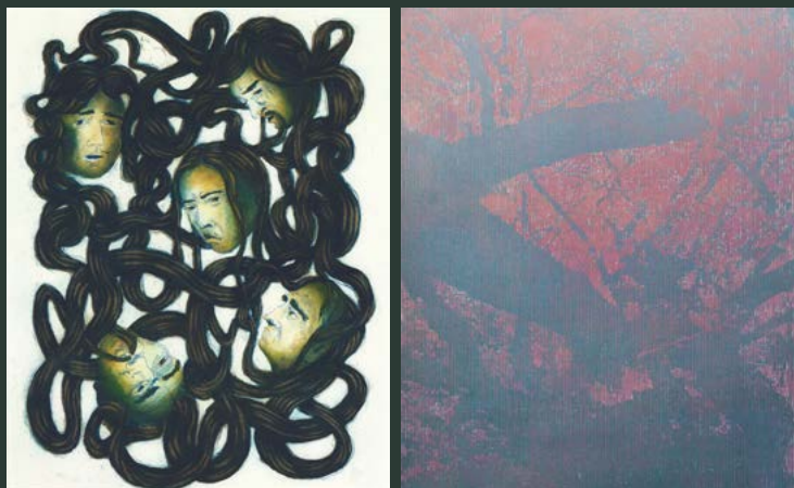
1. Sudi | Soul | Archival pigment print 2. Alice Maher | Rokuro-Kubi | Etching 3. Katsutoshi Yuasa | 16 Zakura | Woodblock