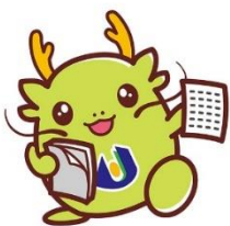
「オロリン」 島根県立大学 マスコットキャラクター