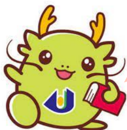
島根県立大学 マスコットキャラクター オロリン