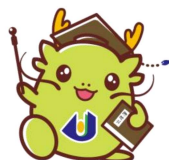
県大マスコットキャラクター オロチン