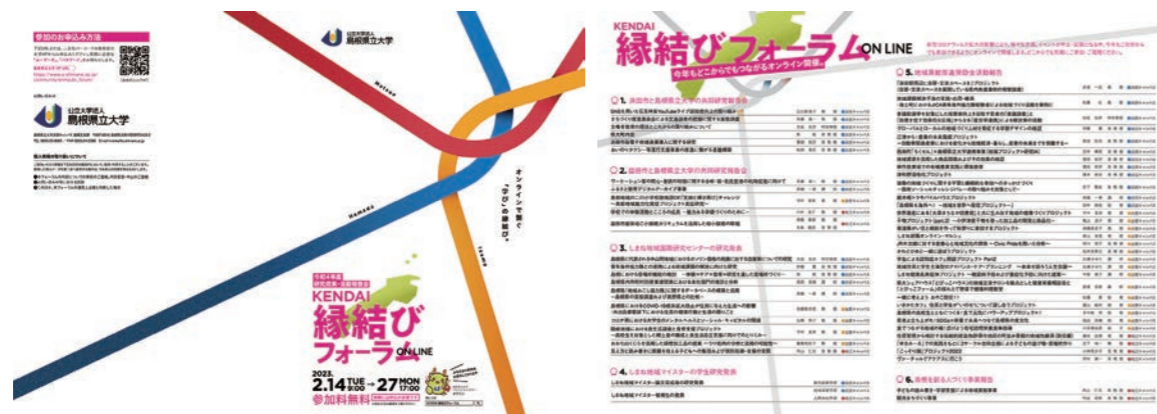
縁結びフォーラムパンフレット