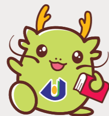
マスコットキャラクター 「オロリン」