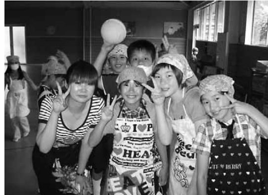
▲託児ボランティア