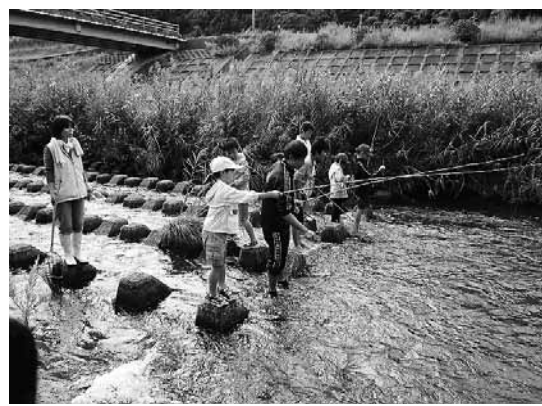
▲わくわく理科講座