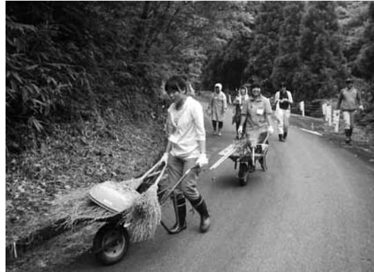
▲草刈りボランティア