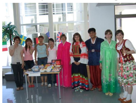
Сотрудники и иностранные студенты НИА-Центра