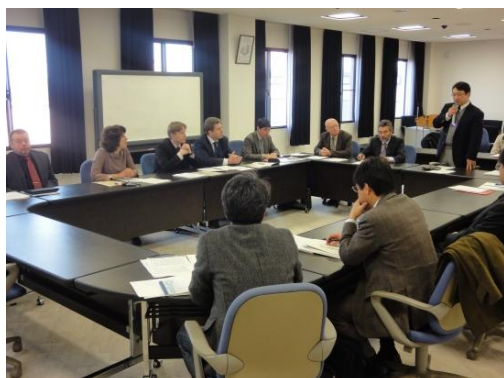
Во время международного научного семинара