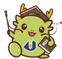
島根県立大学 マスコットキャラクター オロリン